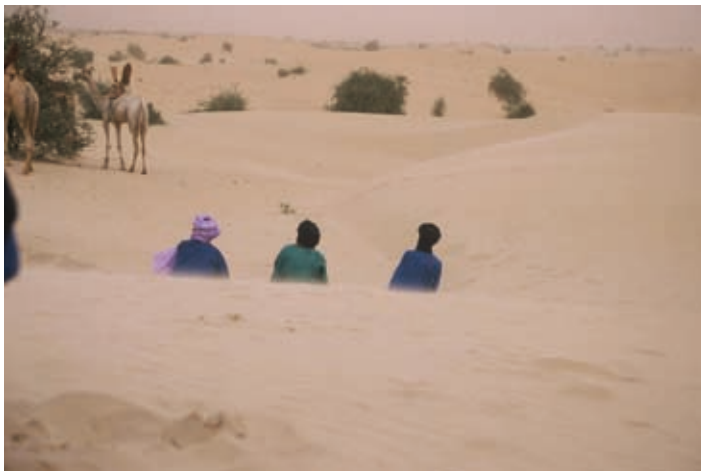
Fotografia de M a Josep Guixot Rovira guanyadora del concurs fotogràfic d'enguany, organitzat pel Centre de Desenvolupament Infantil i Atenció Precoç.